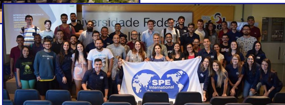
Foto oficial do encerramento do III Meeting SPE UFPel.