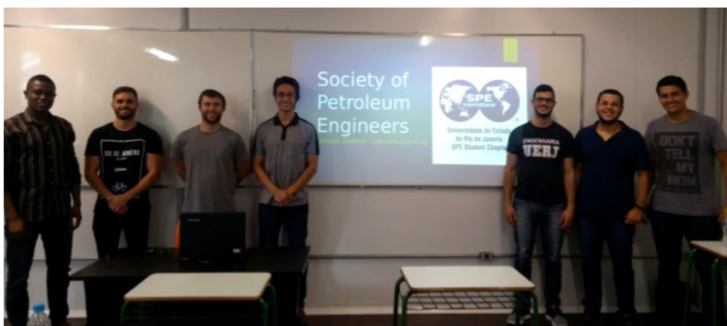
Diretoria do Novo Capítulo Estudantil SPE - UERJ (Campus de Nova Friburgo - RJ)

O Capítulo Estudantil da Universidade do Estado do Rio de Janeiro - Campus Nova Friburgo foi estabelecido em 15 de Janeiro de 2018, e conta com o seguinte quadro de diretores: